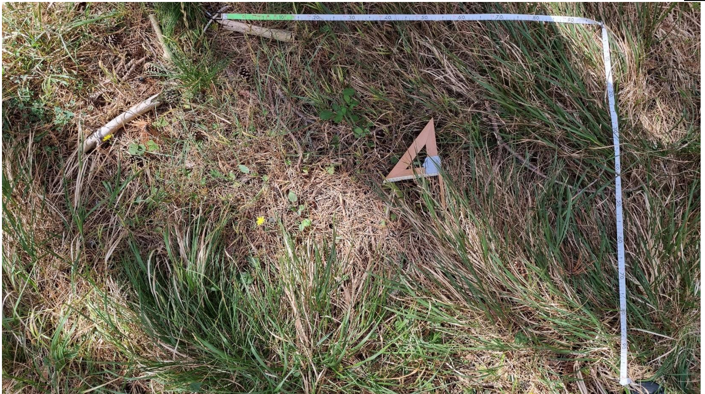
Rilievo Gruzza di Veppo 03 – Particolare