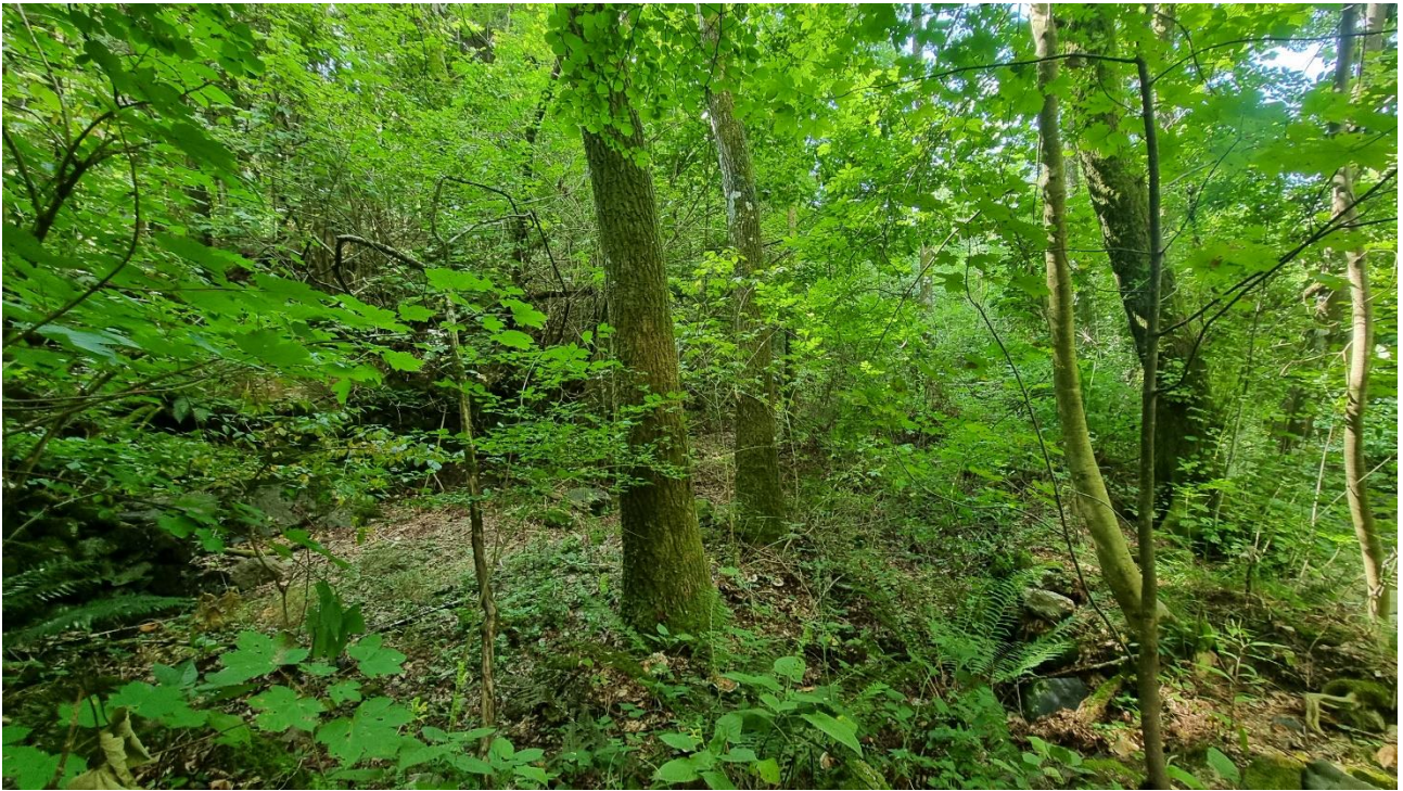
Rilievo Gruzza di Veppo 01 – Il sottobosco