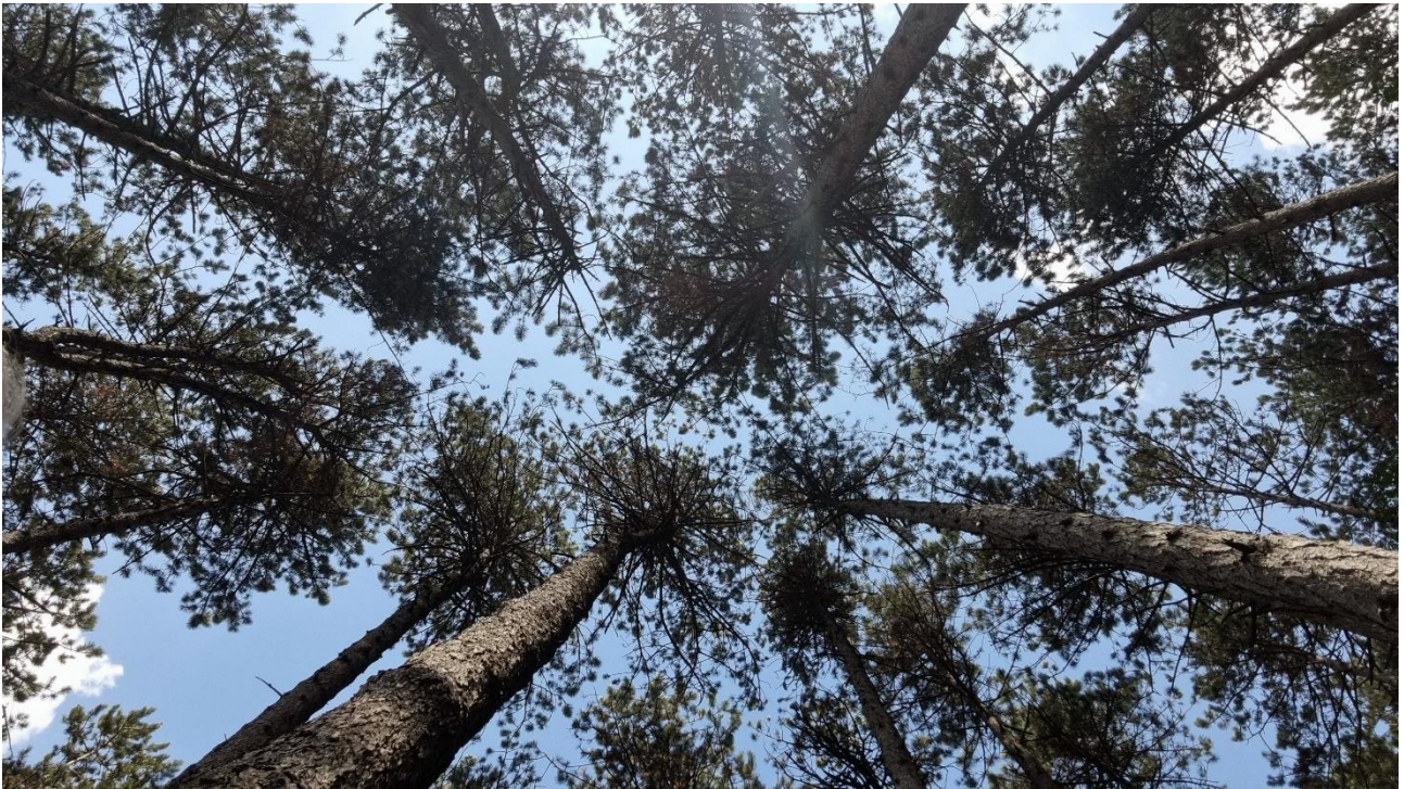
Rilievo Gruzza di Veppo 02 – La volta del bosco