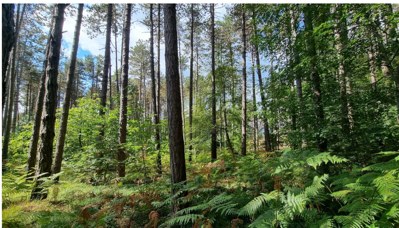
Rilievo Gruzza di Veppo 02 – Il contesto ambientale

Fuori rilievo: Cytisus scoparius , Deschampsia/Festuca fg. rigide, Erica arborea , Solidago virgaurea .