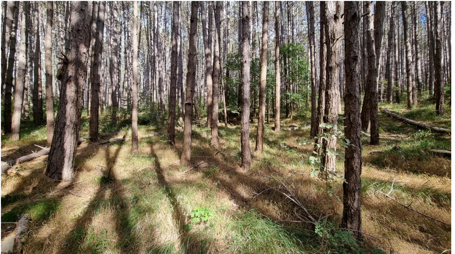
Rilievo Gruzza di Veppo 03 – Il contesto ambientale